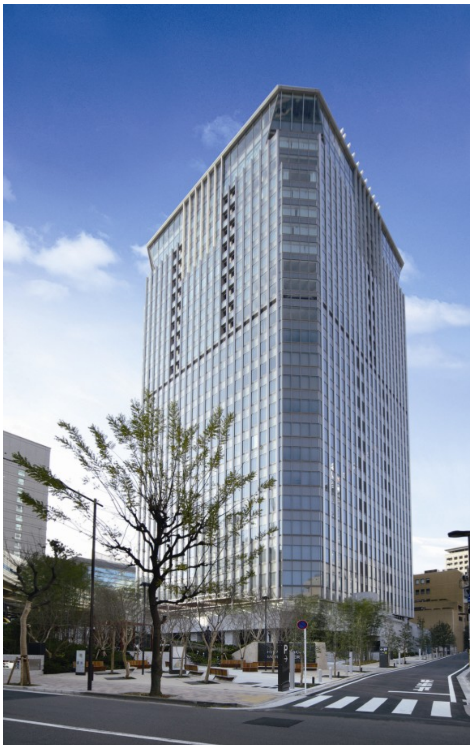
<参考資料 1> 平河町森タワー 外観写真