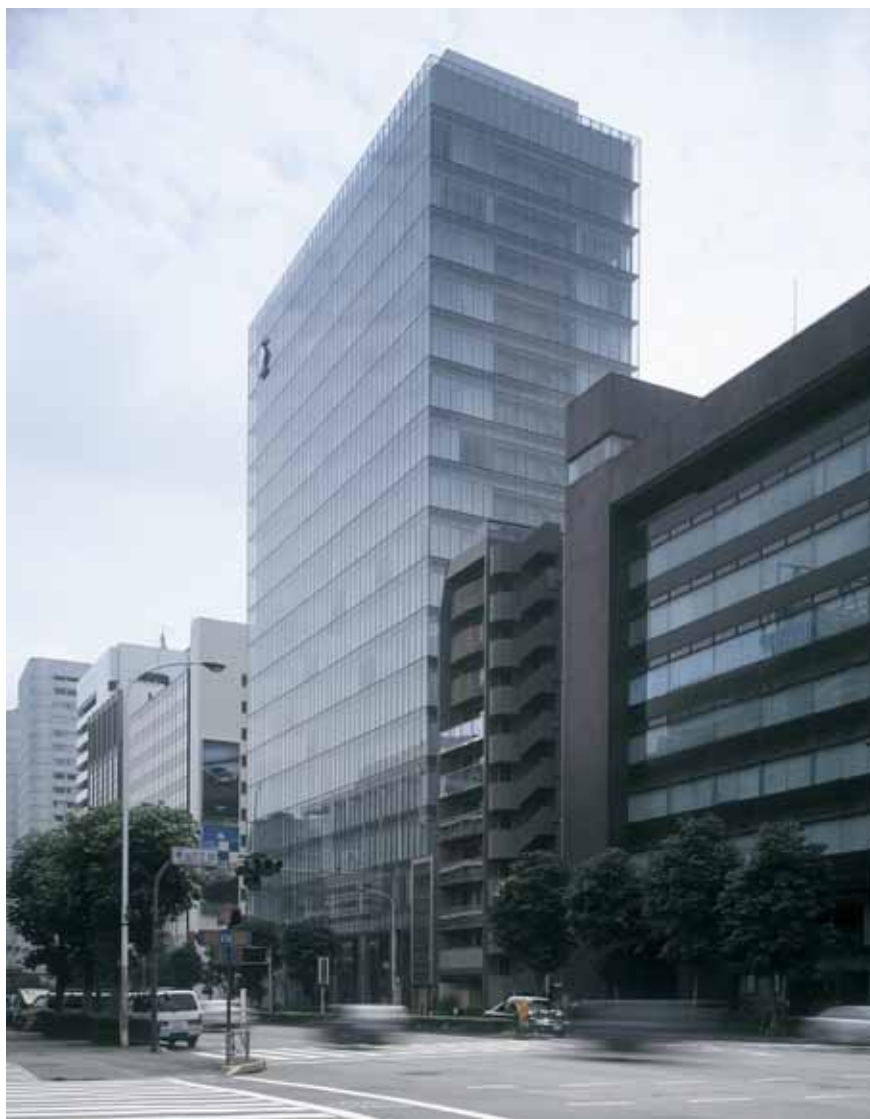
<参考資料 1> TK 南青山ビル 外観写真